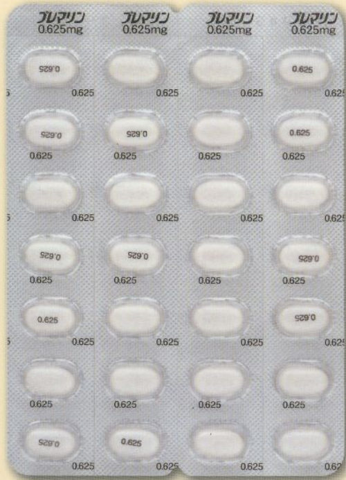
製品名 プレマリン®錠0.625mg 会社名 ワイス株式会社