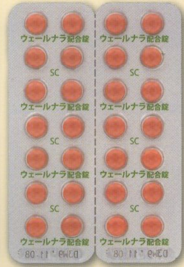
製品名 ウェールナラ®配合錠 会社名 バイエル薬品株式会社