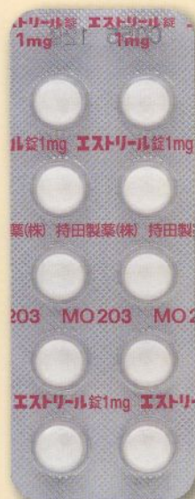
製品名 エストリール錠1mg 会社名 持田製薬株式会社