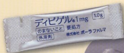
製品名 ディビゲル®1mg 会社名 株式会社ポーラファルマ 持田製薬株式会社