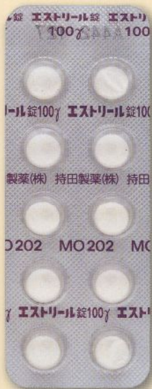
製品名 エストリール錠100γ 会社名 持田製薬株式会社