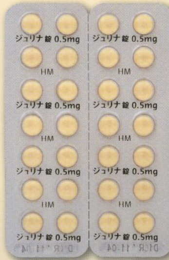
製品名 ジュリナ錠0.5mg 会社名 バイエル薬品株式会社