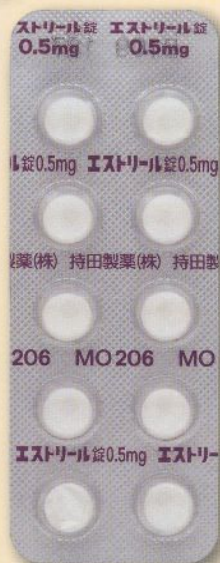
製品名 エストリール錠0.5mg 会社名 持田製薬株式会社