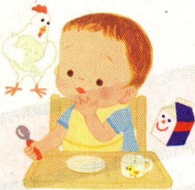
イラスト・さこもみ

検査時期は離乳食を始める前の生後5カ月ころがよいでしょう。鶏卵や牛乳アレルギーがあれば、ほとんどが生後6カ月までには陽性となりますが、生後3カ月以前に検査をすると陽性にならないことがあります。