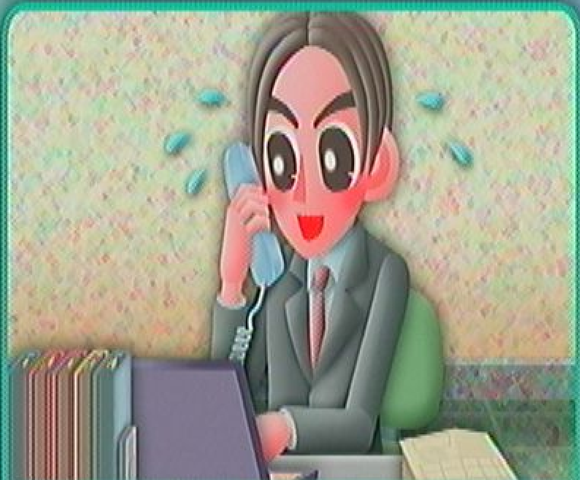
● Aさん 24歳 会社員 ●