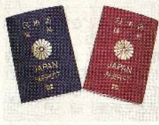
いくとき必ず必要です。 (答えは4面)

での輸送でなら資源を採ってもよいことになっていきます。つまり島を一つ失うと、陸地だけでなく、その周りの海の資源も失うのです。海に面し、その恵みを受けている国にとっては大きな問題です。そもそも国境はどうやって決ま